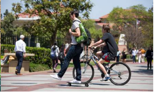
USC 파크 캠퍼스 지도 (PARK CAMPUS)